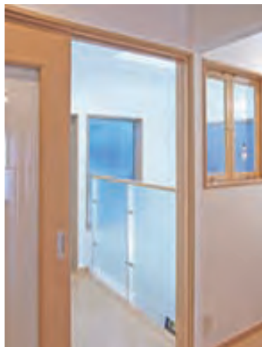
2F バルコニーへの渡り廊下② 右に見える窓は洗面コーナーのもの