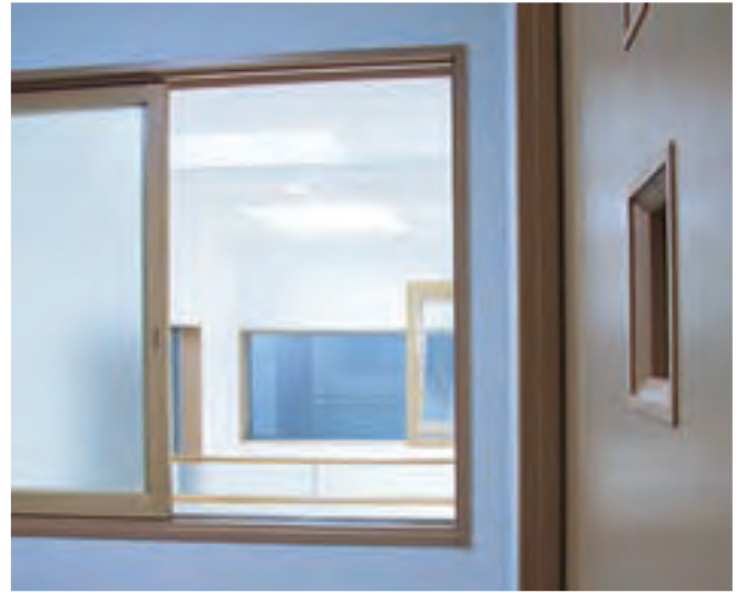
鏡付玄関収納トールユニット & ウォークイン収納 吹抜けからの光がおりる タタミコーナー 2F 部屋の木製窓から明るい吹抜けを眺めて

空間のおもしろさ.. は住まいを立体的に考えることでひろがります。吹抜けを取り入れられたことで、1F 2Fのスペースにつながりができ、遊び心のある住まいが完成しました。いつもおだやかであたたかな、仲のよいご家族の人柄を感じる明るく楽しい住まいには、家族の色々なアイデアが活かされています。玄関まわりの工夫がある収納や、LDの壁面収納に組み込んだパソコンコーナー、吹抜けがみえる爽やかな洗面コーナー etc、etc...。明るさや風通しはもちろんです、訪れる方々にもちょっとした楽しい驚きがある住まいでは、笑い声が絶えない愉快的時間をたくさん過ごせそうです。