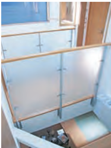
2F バルコニーへの渡り廊下① 下にダイニング&タタミコーナーが見えます。

吹抜けの上のトップライト（天窗）。雨を感知すると自動で閉まる優れもの！心地よい光と風が、はいつてきます。