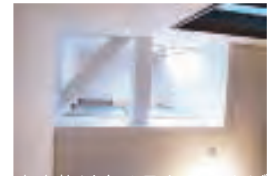
↑吹抜けを1Fから見上げて

BEFORE 写真は2F廊下のつきあたり（購入部分）。そこに吹抜けをつくることで、下にある玄関ホールと、2Fの廊下がとても明るくなりました。