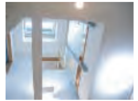
↑吹抜けを1Fから見上げて

暗かったLD（購入部分）の上に吹抜けをつくったことで光や風が取り込める気持ちの良いスペースに。吹抜け部分には、2Fのバルコニーに続く渡り廊下があり、1Fと2Fのつながりが感じられる楽しいダイニングです。