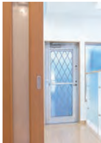
2F バルコニーへの渡り廊下③ 正面がバルコニーへのドア（通風タイプ）